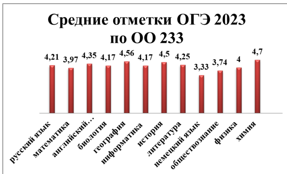
Сравнение отметок ГИА-9 2022 и 2023 годов